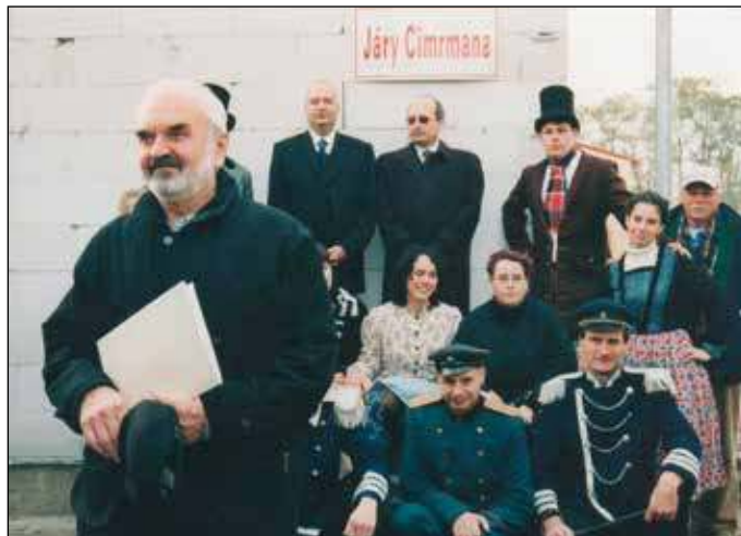
Ze slavnostního pojmenování ulice Járy Cimrmana

Járu Cimrmana zná asi každý. Téměř se stal největším Čechem, to hovoří