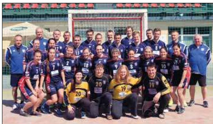
Společná fotografie reprezentace Moravy

To, že oddíl národních házenkářů 1. NH BRNO bojuje každoročně o nejvyšší příčky ve své soutěži, je pod Špilberkem poměrně známá věc. Málokdy se však stane, že by do krásného areálu v Řečkovících přijel ten nejlepší výběr z celé České republiky. Stalo se tak teprve podruhé v samostatné historii klubu, který byl založen v roce 2003. Naposledy pořádali Brňané reprezentační mezizemská utkání Čechy – Morava v červnu 2008.