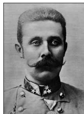
Arcivévoda František Ferdinand