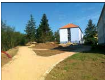
Pohled do budoucího parku od ul. Dudičovy

Ještě nedávno tudy bylo možno volně projít, různé prošlapané pěšinky v trávniku a keřích za obytnými bloky na konci Sibiřské k tomu vybízely. Dalo se jít i téměř po hraně vytěžené jámy, jejíž jíl se kdysi báječně hodil na výrobu cihel. Je sice pravda, že chůze byla s určitým rizikem pádu dolů k zahrádkám, jež vyrostly na dně jámy. Těžba jílu a výroba cihel skončily někdy před 70-80 lety a stěny jámy