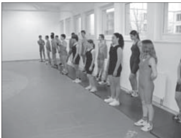
Snímek z ukázkového cvičení mladých sportovců.