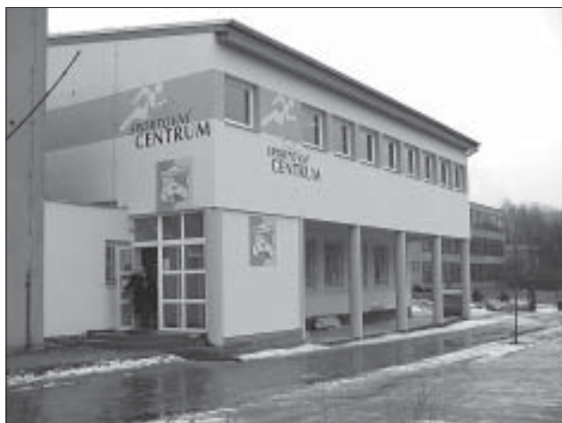
Sportovní centrum má dnes novou tvář.