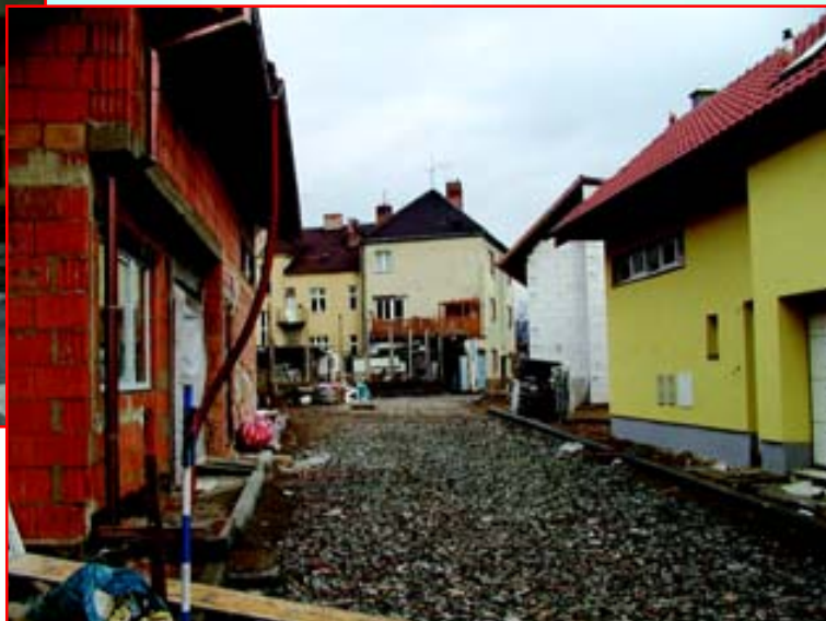
Rozestavěná ulice Járy Cimrmana

V Čechách dosáhlo Cimrmanovo životní dílo vrcholu. Jako kočovný dentista procházel snad všemi kouty naší vlasti. Český lid ochotně otvíral ústa a svěčoval se mu se všemi svými starostmi a trampotami. Z toho pak Cimrman vytěžil látku pro své nesmrtelné divadelní hry. Byla to dramata takové umělecké síly, že ani nemohla být svými současníky pochopena.