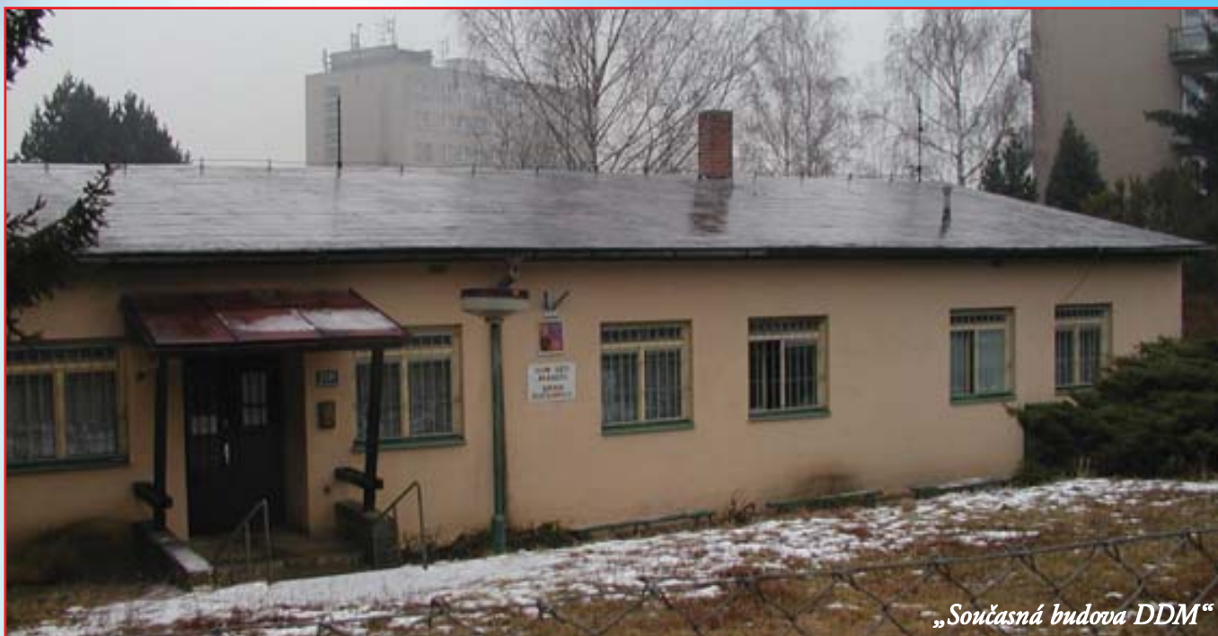
„Současná budova DDM“

Dům dětí a mládeže na Ječné ulici se v loňském roce dostal do existenčních potíží. Soukromý vlastník objektu, v němž DDM sídlí, požadoval z důvodu nutnosti oprav budovy vyšší nájemné. Jihomoravský kraj, zřizovatel Domu dětí a mládeže Ječná 26, odmítl dlouhodobě akceptovat zvýšení nájmu a nehodlal ani příliš řešit budoucnost tak potřebného zařízení v naší městské části. Pro udržení DDM v Řečkovicích stanovilo vedení městské části 7 variant řešení včetně krajní varianty, spočívající v ukončení pronájmu hudební školy