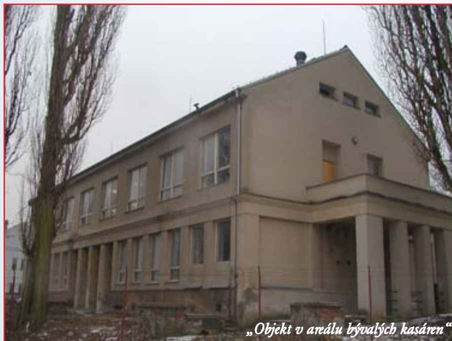
„Objekt v areálu bývalých kasáren“