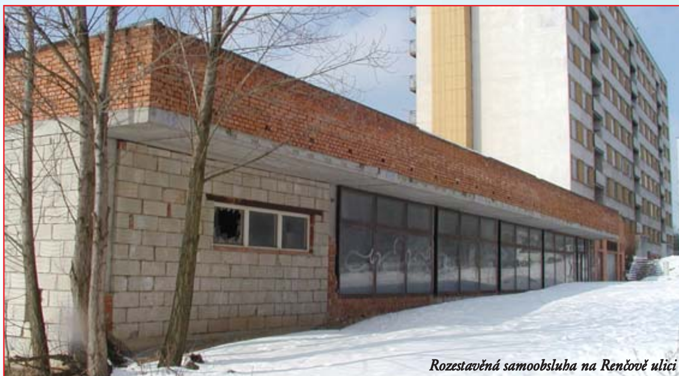
Rozestavěná samoobsluha na Renčově ulici