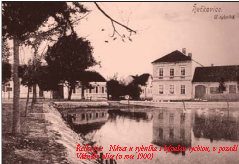
Řečkovice - Náves u rybníka s bývalou rychtou, v pozadí Vážného ulice (v roce 1900)

Zpracovaná expertíza vyvrátila mýty o vysoké hladině podzemní vody s bohatými přítoky na Palackého náměstí v místech bývalého rybníku. Hydrogeologické poměry se po provedení nové kanalizace nezhorší a kvalita vody se vrátí do normálu. Informace o připravované rozsáhlé rekonstrukci kanalizace v prostoru Palackého náměstí přineseme v některém z dalších čísel zpravodaje.