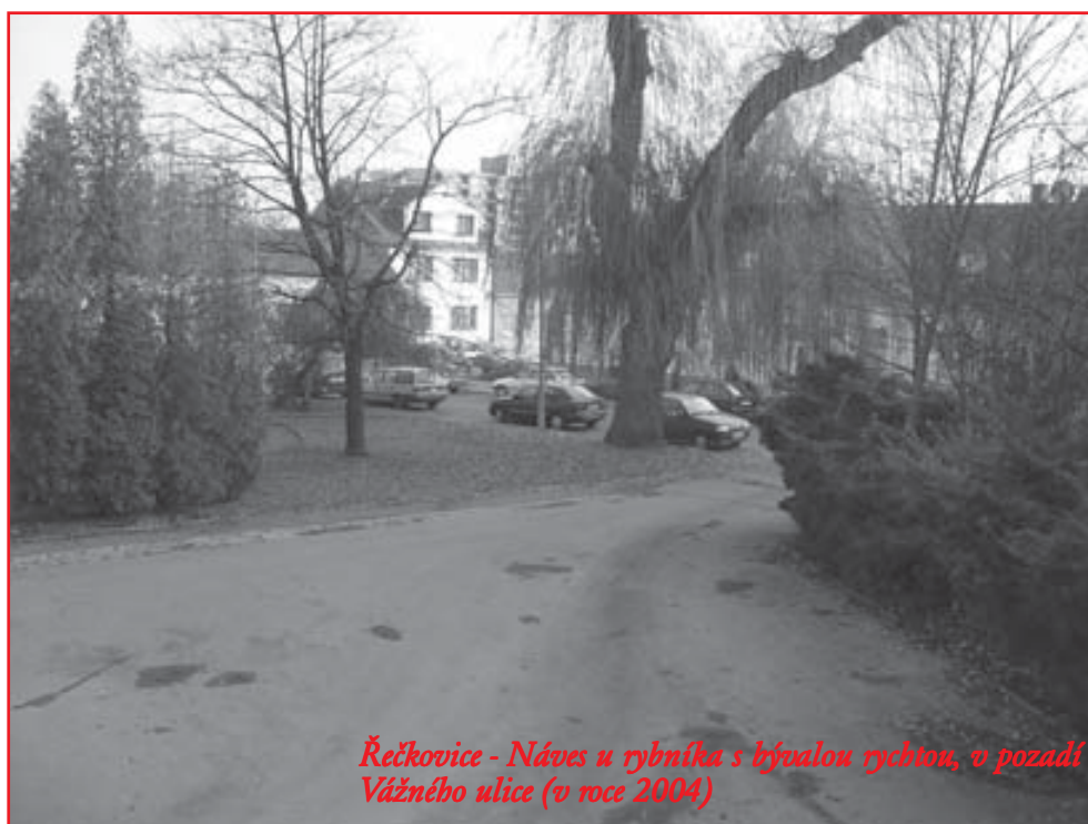
Řečkovice - Náves u rybníka s bývalou rychtou, v pozadí Vážného ulice (v roce 2004)