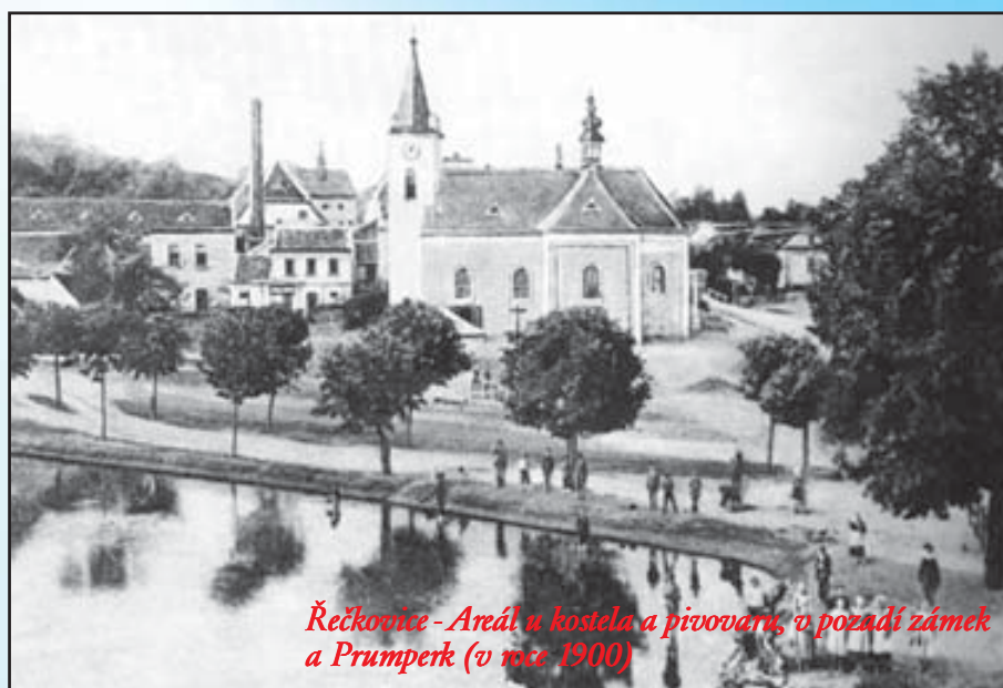
Řečkovice - Areál u kostela a pivovaru, v pozadí zámek a Prumperk (v roce 1900)

V první fázi bylo nutno vyhledat stávající studny v okolí plánované trasy rekonstrukce kanalizace, aby bylo možno určit úroveň hladiny podzemní vody a určit izolinie hladiny v širším okolí. Existoval předpoklad, že stávající netěsná kanalizace drénuje přítok balastních vod z jejího okolí. Nová těsná kanalizace by takovou funkci ztratila, mohlo by teoreticky docházet k vzedmutí podzemní vody a případně i zatápění níže položených suterénních a sklepních prostor v části ulice Vážného a Palackého náměstí. Pro zajištění tohoto úkolu bylo nutno v okolí trasy najít stávající staré studny a objekty pro monitorování podzemní a povrchové vody, vybudovat na Palackého náměstí dva hydrogeologické vrty hluboké až 8 m, vše geodeticky zaměřit a u všech objektů změřit stavy hladiny vody ve 3 termínech v průběhu roku 2004 (duben, srpen a září). Vrtné práce prokázaly, že horninové prostředí je vyplněno svrchními navážkami a v nižších polohách převážně jílovitými kvarténními sedimenty. Následnými hydrodynamickými zkouškami byly v místě vrtů stanoveny propustnostní poměry horninového kolektoru v širším okolí. Zkoušky prokázaly, že se jedná o velmi slabě propustnou zvodeň, z vodárenského hlediska využitelnou pouze malými odběry pro místní zásobování. Pro ilustraci: za 1,5 hodiny byl s vydatností 0,045 l/s z vrtu vyčerpán celý objem vody