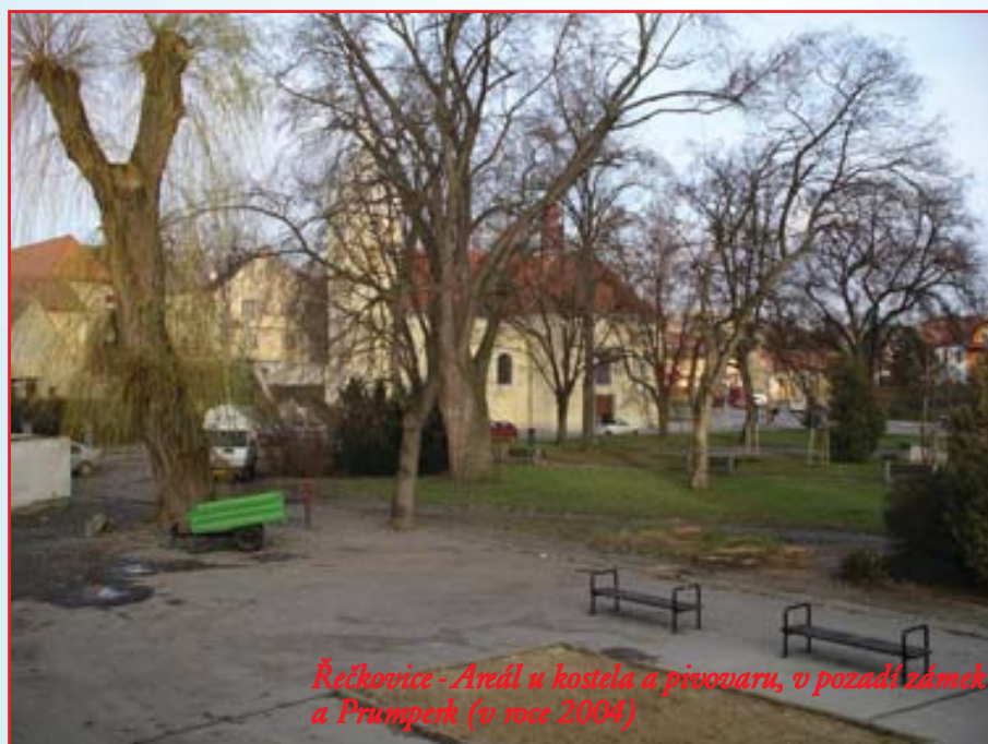
Řečkovice - Areál u kostela a pivovaru, v pozadí zámek a Prumperk (v roce 2004)