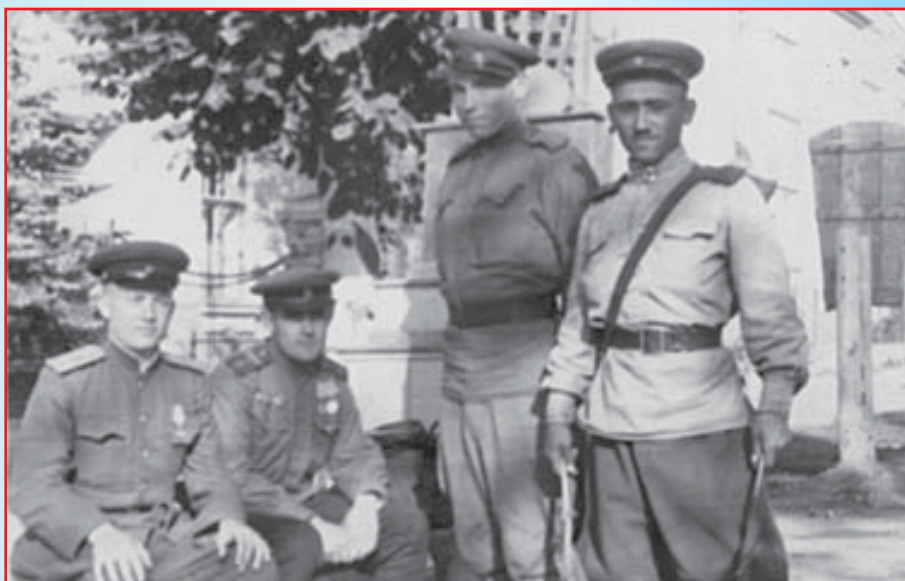
Vojáci na strážním stanovišti při vjezdu do města na ulici T. Novákové.

Jako školákovi mi soudružky učitelky neúnavně a zapáleně vnucovaly kult hrdinství a nadlidské oběti sovětských vojáků. Čím více se snažily, tím více jsem je odmítal a oslavy osvobození bral jako součást komunistické propagandy. Inu nic se nemá přehánět. V dnešní době přiměřené svobody si může každý vybrat svého hrdinu. A možná že teď, když už mi nikdo nic nevnučuje, bych si za svého hrdinu vybral prostého vojína Rudé armády, trochu vykuleného, trochu vystrašeného, trochu špinavého. Takového klučinu, kterému nedali na vybranou a hnali ho od bitvy k bitvě, až se ocitl daleko v cizí zemi, a byl rád, že to všechno přežil. A možná by mohl být mým hrdinou řečkovický pantáta, který, když šla fronta, seděl ve sklepě se svou rodinou, dodával jí odvalu svým