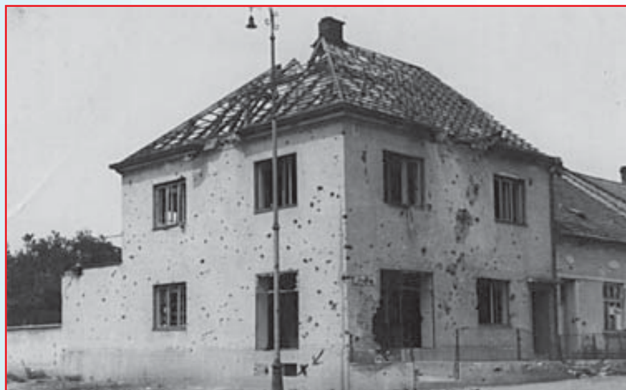
Dům T. Novákové 16, kde se ve sklepě ukrývala rodina paní Burianové.