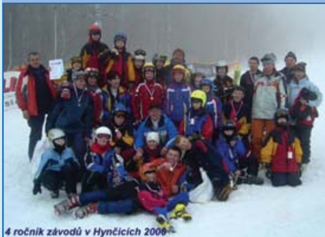
4 ročník závodů v Hynčicích 2006