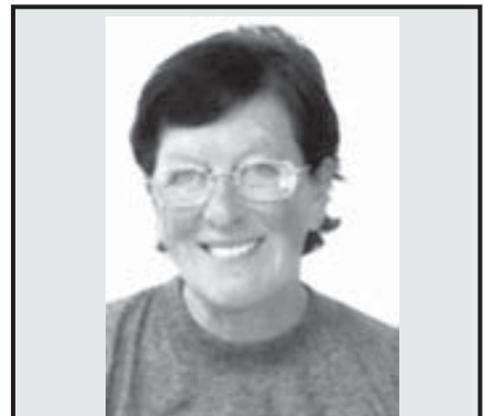
Nedožitě životní jubileum paní učitelky

Pondělí 14. června 2004 15:00 - 18:00 hod.