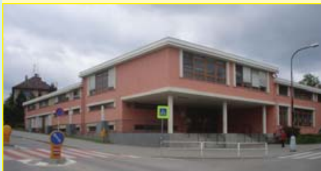
„ZŠ Horácké nám., pracoviště Uprkova 1a“

Na přelomu dubna a května tohoto roku byli rodiče žáků řeckovických základních škol (ZŠ Horácké náměstí - pracoviště Horácké nám. a Uprkova, ZŠ Novoměstská) požádáni o vyplnění dotazníku zpracovaného školskou komisí. Z celkové počtu 1040 anketních lístků se jich vyplněných vrátilo 636. Téměř dvě třetiny rodičů věnovalo svůj čas vyplněním dotazníku, za což jim patří velký dík.