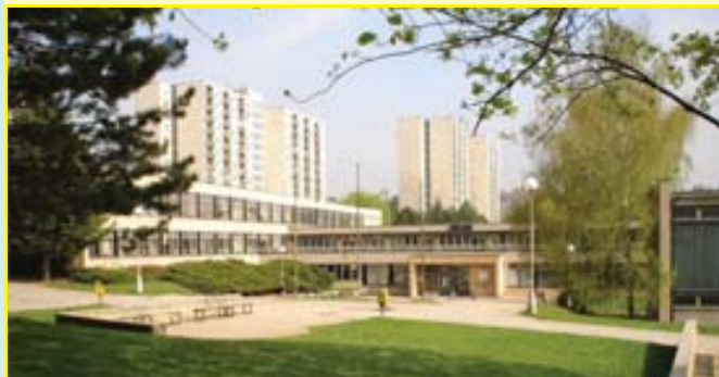
„ZŠ Brno Horácké nám. 13“

Na přelomu dubna a května tohoto roku byli rodiče žáků řeckovických základních škol (ZŠ Horácké náměstí - pracoviště Horácké nám. a Uprkova, ZŠ Novoměstská) požádáni o vyplnění dotazníku zpracovaného školskou komisí. Z celkové počtu 1040 anketních lístků se jich vyplněných vrátilo 636. Téměř dvě třetiny rodičů věnovalo svůj čas vyplněním dotazníku, za což jim patří velký dík.