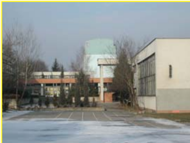
„ZŠ Brno Novoměstská 21“

Anketa bude poskytnuta vedení škol, pro veřejnost jsou detailní výsledky k dispozici na stránkách www.reckovice.cz . Za přípravu a vyhodnocení ankety patří poděkování školské komisi rady městské části pod vedením MUDr. Evy Fajkusové, za realizaci ankety a pochopení patří dík vedení škol a učitelům.