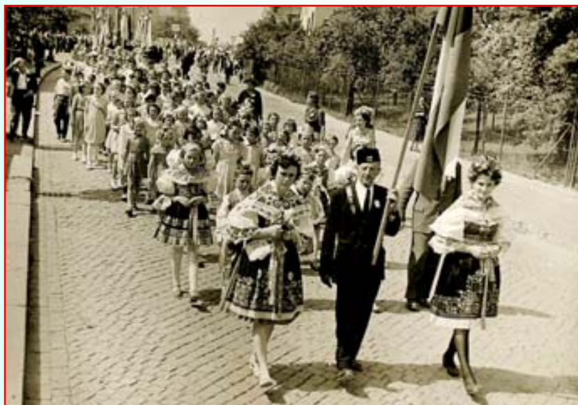
Slavnostní průvod ke sboru dne 30. 6. 1957.