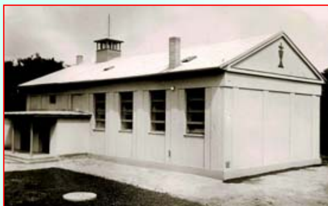
Nově otevřená budova Husova sboru.

Nové náboženské hnutí překonávalo počáteční těžkosti a sílila touha po vybudování vlastního Husova sboru. Teprve v roce 1930 byl založen fond k výstavbě sboru v chudé náboženské obci. Čekali jsme dlouhá léta a sám Bůh nás učil trpělivostí. Od 1. ledna 1940, v těžké době druhé světové války, bylo započato s výběrem darů na stavbu sboru. V březnu 1940 bylo státními úřady schváleno vytvoření nové náboženské obce v Řečkovících, kde se plně zapojila do rostoucího díla církve, aby sloužila celému národu. S vděčností tak vzpomínáme na vykonanou práci těch, kteří už nejsou mezi námi.