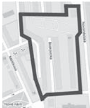
navrhovaný prostor ul. Novoměstská, Kunštatská mapa: Copyright PLANstudio s.r.o.

V přízemních prostorách radnice městské části Brno - Řečkovice a Mokrá Hora, Palackého náměstí 11 se uskuteční od 2. června do 31. července 2008 výstava prací studentů zahradní a krajinářské architektury Mendelovy zemědělské a lesnické univerzity v Brně, kteří se v rámci semestrálních prací zabývali návrhy na úpravu a ozelenění veřejných prostranství v areálu nákupního centra Vysočina a v parku mezi ulicemi Novoměstskou 41 - 45, včetně navazujících ploch kolem bytových domů v ulici Boskovické a Novoměstské.