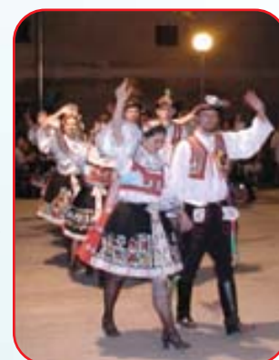
Odchod stárků na závěr hodů