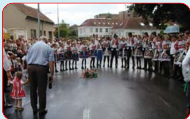
Zastavení hodového průvodu na Palackého nám.