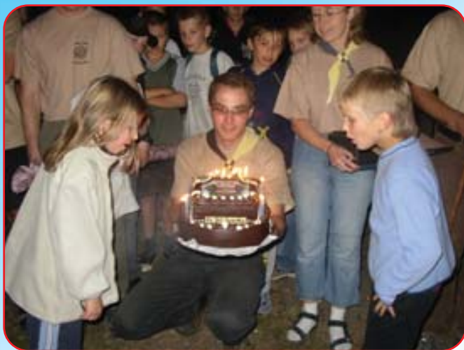
„Narozeninový dort Severky“