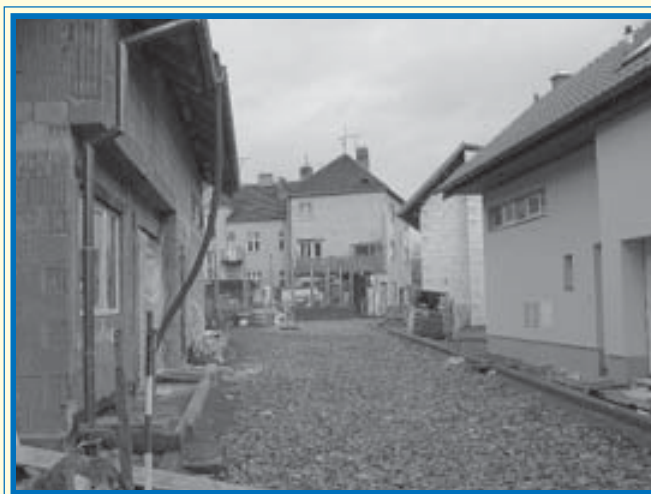
Ulice Járy Cimrmana v Řečkovících

V prostorách radnice bude k této příležitosti zřízena rovněž výstava prací žactva a studentstva o Mistrově díle. Obyvatelstvo místní i přespolní bude moci výstavu volně navštívit zvláště v úřední dny od 11. listopadu do konce roku.