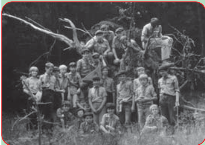
„Dobrou fotografii oddílů“

Pro oddíl je to už úctyhodný věk! Za tu dobu se mnoho desítek kluků a děvčat zúčastnilo několika stovek schůzek, výprav, mimořádných podniků, družinovek, strážních služeb, táborů a řady dalších akcí.