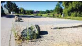
Pétanque hřiště na Mokré Hoře