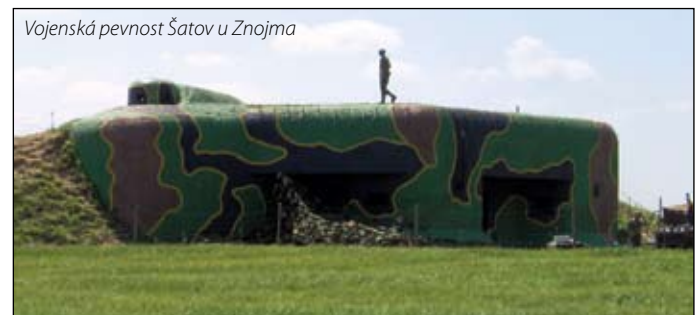
Vojenská pevnost Šatov u Znojma

To je pro další dramatický vývoj naší země velmi důležité – suverénní stát byl rozhodnutím z Mnichova připraven o svoje svaté právo – postavit se agresorovi na obranu své svrchovanosti. Takže pokud by tak v očích mnichovských signatářů bylo prezidentem E. Benešem a vládou skutečně učiněno a naše republika šla sama do obranné války s Německem, byla by označena za viníka vzniklé války. V této tragické situaci mohlo Československo obranně volit jen mezi vraždou a sebevraždou, jak tehdy trefně konstatovala generalita naší armády. A i když by v nastalé celoevropské koalici válce bylo Německo poraženo, západní velmoci již předem alibisticky prohlásily, že nemohou Československu automaticky garantovat navrácení předmnichovského stavu. V praxi to mohlo znamenat, že po válce, byť by skončila dříve než v roce 1945, by sice samostatné Československo bylo zřejmě znovu obnoveno, ale např. pouze v okleštěné pomnichovské podobě, neboť ztracené pohraničí by s největší pravděpodobností zůstalo poraženému Německu.