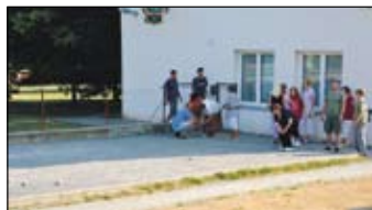
Orelské hřiště na Pétanque