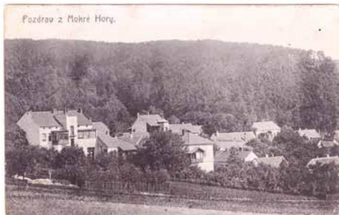
Pohled na Mokrou Horu v 30. letech min. stol.

K půlnoci z 1. na 2. prosince 1930 se uskutečnilo druhé československé sčítání lidu. Mimo jiné byla zjišťována gramotnost obyvatelstva, tj. znalost čtení a psaní, plodnost žen, minulé bydliště, zazněly otázky na tělesné vady (vzhledem k relativně nedávno ukončené válce), informace o hlavním i vedlejším povolání.